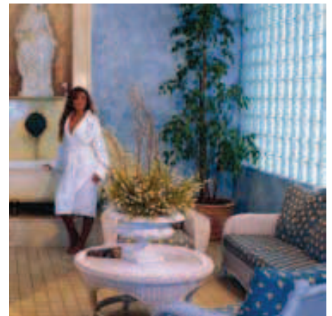
EL PALASIE &gt; Foto: D.R.