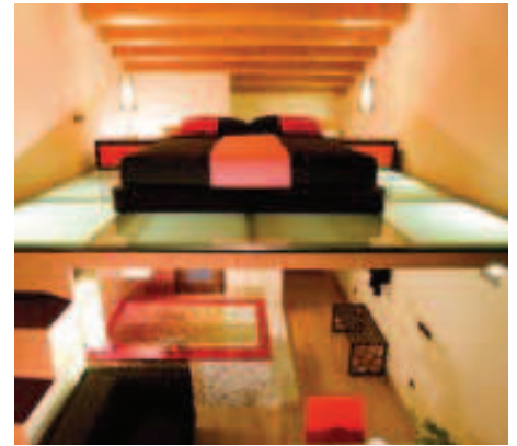
CASTELL DE LA SOLANA

INSTALACIONES 2 Hoteles, 5* y 4*, Golf, Spa & Fitness, Pádel & Tenis, Restaurantes, Salones, etc.