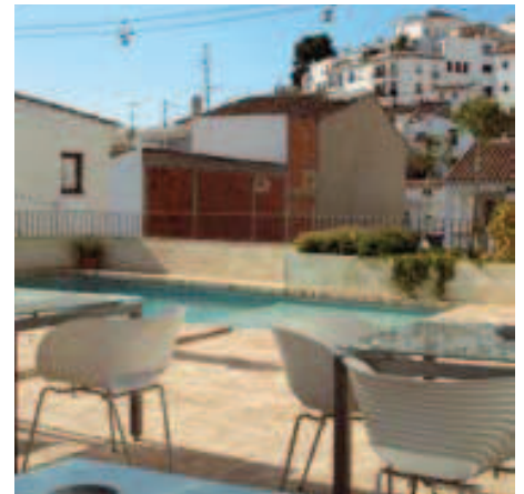
LA SERENA &gt; Foto: D.R.